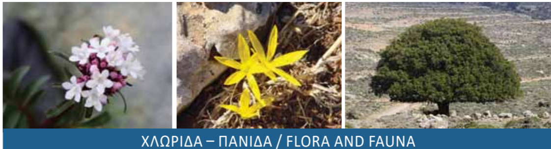
ΧΛΩΡΙΔΑ – ΠΑΝΙΔΑ / FLORA AND FAUNA

Τόπος ευλογημένος, η Ιεράπετρα κρύβει μια μεγάλη ποικιλία από ανεκτίμητα και σπάνια οικοσυστήματα που παρουσιάζουν εντυπωσιακή ενδημικότητα σε είδη χλωρίδας και πανίδας. Αυτό οφείλεται κυρίως στη γεωγραφική θέση, τη γεωμορφολογία και το κλίμα της περιοχής. Πολλά από τα είδη είναι απειλούμενα και προστατεύονται από την Εθνική και τη Διεθνή νομοθεσία.