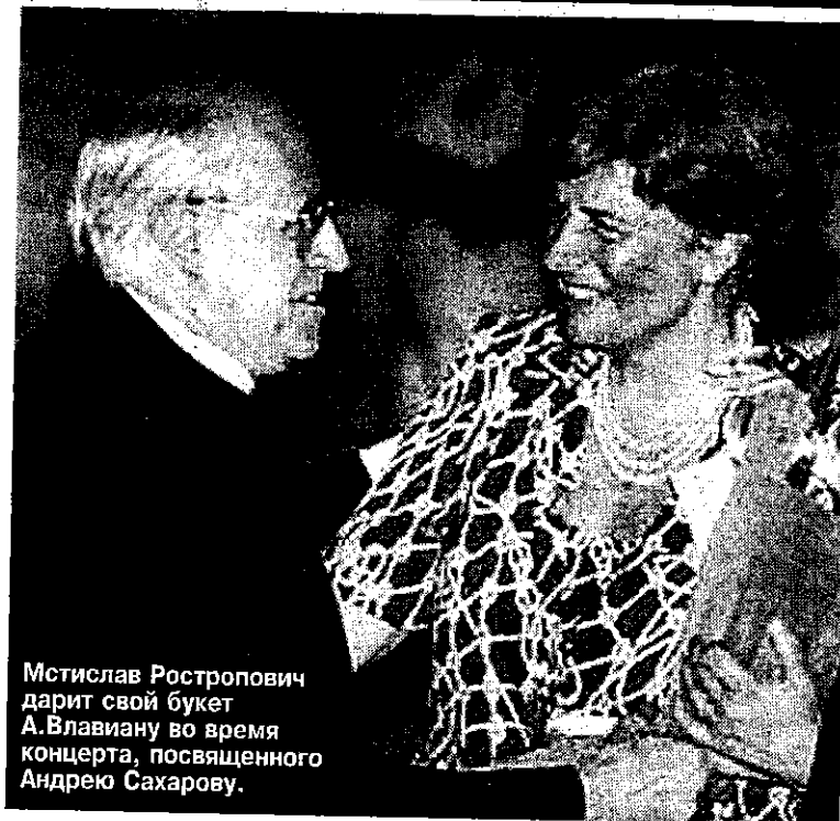
Мстислав Ростропович дарит свой букет А.Властиану во время концерта, посвященного Андрею Сахарову.

такое сотрудничество абсолютно невозможно. Но мой близкий друг, турок из Трапезунда, воодушевился идеей биодипломатии, и мы провели совместно с местными номархиями и университетами почти 50 мероприятий. Я уже сказала вам, что самый широкий отклик я нашла в России, которую я до этого очень мало знала: я училась и работала в США и Франции. В России мне сказали, что постулаты биополитики более всего отвечают идеалам Андрея Сахарова. Меня это сразило, ибо я выросла в глубочайшем уважении к академику Сахарову и его делу.