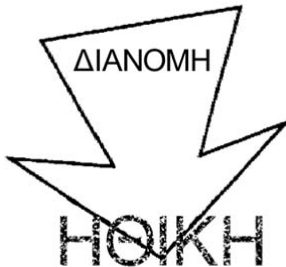
Σχήμα 2. Ηθική - Επανεπένδυση - Κοινωνική Σφαίρα- Περιβάλλον

Τα φυσικά αποθέματα θα μειωθούν και θα γίνεται όλο και ακριβότερη η απόκτησή τους. Αυτό θα σημαίνει υψηλότερες απαιτήσεις σε ενέργεια, δηλαδή η χρήση τους θα προκαλεί μεγαλύτερη ρύπανση του περιβάλλοντος. Μείωση των πηγών πρώτων υλών θα προκαλέσει αντίστοιχη μείωση στην παραγωγή βιομηχανικών προϊόντων και τροφίμων. Είναι μέρος της ανθρώπινης φύσης η επιθυμία για καλύτερες συνθήκες διαβίωσης και υψηλότερη ποιότητα τροφής. Αν οι σημερινές τάσεις δεν αλλάξουν, αργά ή γρήγορα ο πολιτισμός μας θα παρακμάσει. Η ένδεια, το ακάθαρτο περιβάλλον, η μειωμένη αντίσταση στις μολύνσεις και παρόμοιες επιπτώσεις θα συνεισφέρουν. Η ανθρώπινη επιθετικότητα, ο εγωισμός, η ανευθυνότητα και η δύναμη είναι εχθροί μας. Θα μπορέσουμε να σπάσουμε αυτόν το φαύλο κύκλο μόνο αν σταματήσουμε τις τάσεις αυτές. Πρέπει να αλλάξουμε τον τρόπο σκέψης και συμπεριφοράς μας (Σχήμα 2).