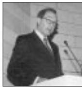
Paul Brouwer Πρέσβης της Ολλανδίας

Είναι μεγάλη τιμή για μένα να παρεννόησκα στην τελετή απονομής του Βραβείου του Βίου. Είναι ένα πολύ σημαντικό γεγονός, δεδομένου ότι το τιμώμενο πρόσωπο είναι ο πρώην πρωθυπουργός της Ολλανδίας. Θέλω να σας διαβεβαιώσω ότι είμαστε πολύ υπερήφανοι που η Βιοπολιτική επέλεξε να απονείμει αυτό το βραβείο στον Ruud Lubbers. Το βραβείο τονίζει επίσης ότι, στην Ολλανδία, αποδίδουμε μεγάλη σημασία στην προστασία του περιβάλλοντος και του βίου. Το Βραβείο του Βίου έχει στο παρελθόν απονεμηθεί σε εξεχουσες μεγάλης κλίμακας όπως ο J. Cousteau και ο M. Rostropovich. Θα επιθυμούσα να εκφράσω την ευγνωμοσύνη μου στην Δρα. Βλαβιανού-Αρβανίτη για τις προσπάθειές της και για την τιμή που κάνει σ' έναν συμπατριώτη που είναι ευρύτερα γνωστός. Ως Ύπατος Αρμοστής, ο Ruud Lubbers έδωσε πάντα μεγάλη σημασία στη σχέση του περιβάλλοντος και της ζωής των προσφύγων. Αυτή τη στιγμή, ο κόσμος διανύει δύσκολους καιρούς με επικείμενες κρίσιμες αποφάσεις, αλλά είναι ανακουφιστική η σκέψη ότι άνθρωποι όπως ο Ruud Lubbers είναι παρόντες για να βοηθήσουν στην αντιμετώπιση των συνεπειών αυτών των αποφάσεων. Εύλογα, στην Ολλανδία, είμαστε εξαιρετικά υπερήφανοι γι' αυτόν, λόγω της σταδιοδρομίας, των επιτευγμάτων και του διεθνούς κύρους του. Η σημερινή βράβευσή είναι η επιβεβαίωση αυτής της αλήθειας.