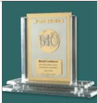
Μαργαρίνος & Πατέρως

“...έχει πραγματοποιήσει ένα εξαιρετικό μητρώο επιτευγμάτων υψηλού επιπέδου, όχι μόνο ως πρωθυπουργός επί 12 έτη, σημειώνοντας τη μεγαλύτερη πρωθυπουργική θητεία στην πρόσφατη ιστορία της χώρας του, αλλά και ως λόγιος, ως καθηγητής και ως ενεργά συμμετέχων στο έργο διαφόρων οργανώσεων του ιδιωτικού τομέα, καθώς και μη κυβερνητικών οργανώσεων.” Κόφη Αννάν, Γενικός Γραμματέας του ΟΗΕ