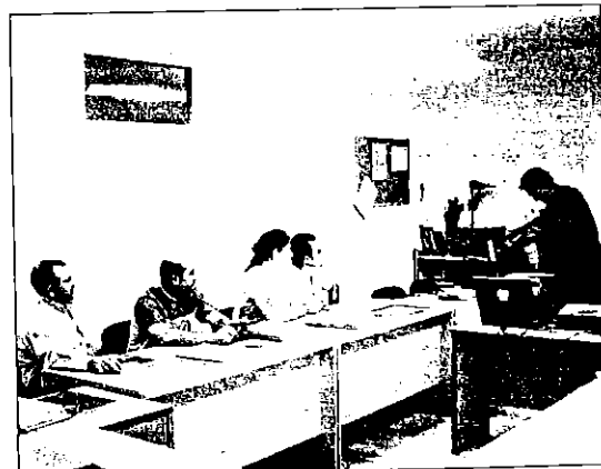
Se impartirán un total de siete cursos en varias localidades de la provincia. L.T

deración de Empresarios de Cuenca ha organizado estos cursos, dirigidos a activos, que tendrán una duración de 50 horas cada uno. En concreto se desarrollarán en las localidades de San Clemente, Sinsante, Iniesta, Tarancón y Cuenca, y en ellos se formará a más de un centenar de trabajadores y empresarios. En los distintos cursos se impartirán contenidos tanto prácticos como teóricos, en temas de seguridad e higiene en el trabajo, normativa básica, riesgos, etc.