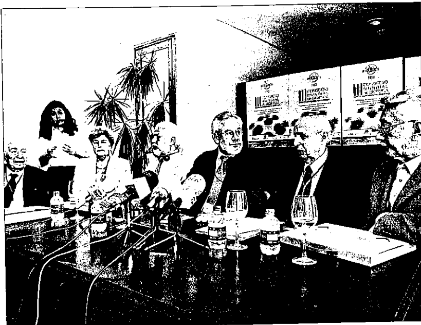
Algunas de las personas que intervinieron en el Congreso destacaron lo importante que es el agua.