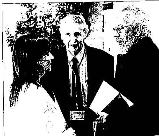
El científico Santiago Grisolía (centro).