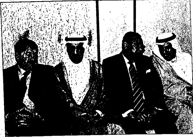
سعيد الكندي وعدد من الحضور

استقبل سمو الشيخ حمدان بن راشد آل مكتوم نائب حاكم دبي وزير المالية والصناعة في ديوان صاحب السمو حاكم دبي صباح أمس الدكتور علي محمد شين نائب رئيس جمهورية تنزانيا المتحدة. وجرى خلال اللقاء تبادل الحديث بين سموه والضيف حول مجمل العلاقات الثنائية القائمة بين دولة الإمارات وتنزانيا وسبل توسيع أطر التعاون بحيث يغطي قطاعات التجارة والاستثمار والسياحة. وقد أشاد نائب الرئيس التنزاني بعلاقات الصداقة القائمة بين القيادتين والشعبين وحرص بلاده على تنميتها بما يحقق المصالح المتبادلة للطرفين. وعبر عن إعجابهم بمسيرة النهضة التنموية التي تشهدها دولة الإمارات على مختلف