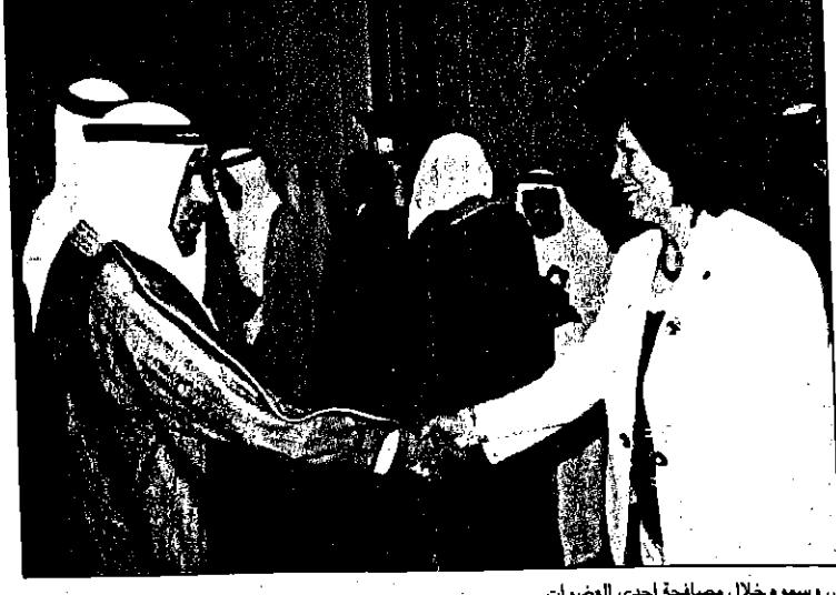
وسموه خلال مصافحة إحدى العضوات