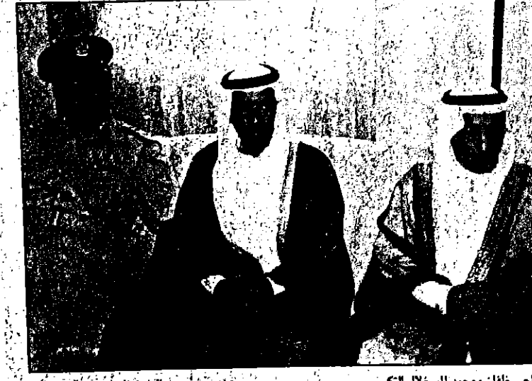
ضاحي خلفان ومحمد المر خلال التكرم

بوظلي - ماجدة ملاوي: افتتح اللواء محمد هلال الكعبي نائب رئيس كيان القوات المسلحة أمس معرض الصور فوتوغرافية الذي ينظمه المركز الثقافي الاجتماعي التابع للإتحاد النسائي بالتعاون مع المتحف العسكري بمناسبة الاحتفال بالذكرى التاسعة والعشرين لتوحيد القوات المسلحة والذي يضم صوراً فوتوغرافية تؤرخ لنشاطاتها وتطورها خلال العقود الماضية. وأشاد اللواء محمد الكعبي بمستوى النشاطات الثقافية والاجتماعية التي يقدمها المركز الثقافي الاجتماعي بمدينة الضباط في أبوظبي والتي تبهم في رفع المستوى الفكري للسيدات في هذه المنطقة، إضافة إلى الدور التوعوي الذي يقوم به المركز من خلال المحاضرات والندوات الدينية