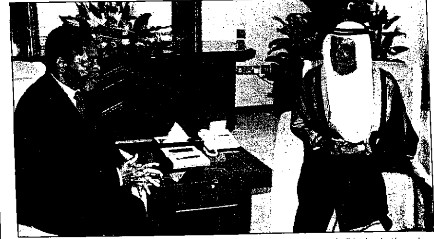
حمدان بن راشد لدى استقبال نائب رئيس تنزانيا

مستلزمات تسجين السيارة والتأمين عليها وصيانتها واستهلاكها من الوقود، ويستثنى من ذلك نفقات وقود سيارة مدير الدائرة حيث تصرف له نقداً وبواقع ألف درهم شهرياً. المادة (5) إذا انتهت خدمة الموظف لأي سبب كان - باستثناء الوفاة - أو تم نقله إلى دائرة أخرى خلال المدة المشار إليها في المادة (3) من هذا المرسوم، فإنه يسترد منه مبلغاً يعادل 25% من البدل للمديرين و20% من البدل لفئات المستحقين