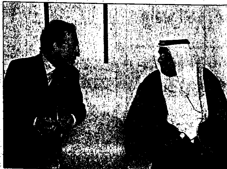
وسوءه خلال استقباله رئيس المركز

وسعيهما الذؤوب من خلال مؤسسات دولة الإمارات وقنوات الاتصال لتوطيد علاقات الصداقة والتعاون بين شعب الإمارات خاصة والشعوب العربية عامة من جهة وبينها والشعوب الأخرى من جهة ثانية إيماناً من سموها بأن الطريق الأمثل للتعايش السلمي هو تعميق الحوار الثقافي والإنساني بين شتى الحضارات بغض النظر عن انتماءاتها العرقية والدينية والجغرافية. وسوءه رئيس المركز الأوروبي العربي إلى أن أوروبا تدين للعرب والمسلمين في حضارتها وتطورها الحالي نظراً لما للعلماء والمؤرخين العرب والمسلمين من فضل على الحضارة الأوروبية خاصة في مجالات علوم الطب والرياضيات والفلك وغيرها. وأعرب المكتوم عن شكره وتقديره لسفائفة وأعضاء مجلس الإدارة المنصب الخالدة إلى صاحب السمو الشيخ مكتوم وأشار إلى أن هذه الجائزة تعكس إلى الرخسطين الحضريين في