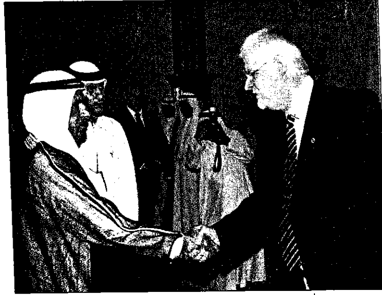
وخلال مصافحة كبار أعضاء الوفد

وتحدث الدكتور أرينز خلال مراسم تسليم الجائزة عن المركز ودوره في بناء ومد جسور الصداقة والحوار بين العرب والأوروبيين من خلال عقد المؤتمرات والندوات والجلسات الحوارية والتشاورية بين مختلف القطاعات السياسية والاقتصادية والثقافية والأكاديمية غير الحكومية وغيرها من القطاعات ذات العلاقة من كلا الجانبين. وأشار في كلمته إلى أن جائزة البيئة والسلام التي منحها المركز أمس إلى صاحب السمو الشيخ مكتوم بن راشد آل مكتوم تقديراً لجهوده ومساعي سموه الخيرة من أجل حماية البيئة في دولة الإمارات والمساعدة على حمايتها في دول كثيرة من العالم وحرص سموه على تحقيق التقارب بين الثقافات والحضارات بمختلف توجهاتها ومشاربها وصولاً إلى